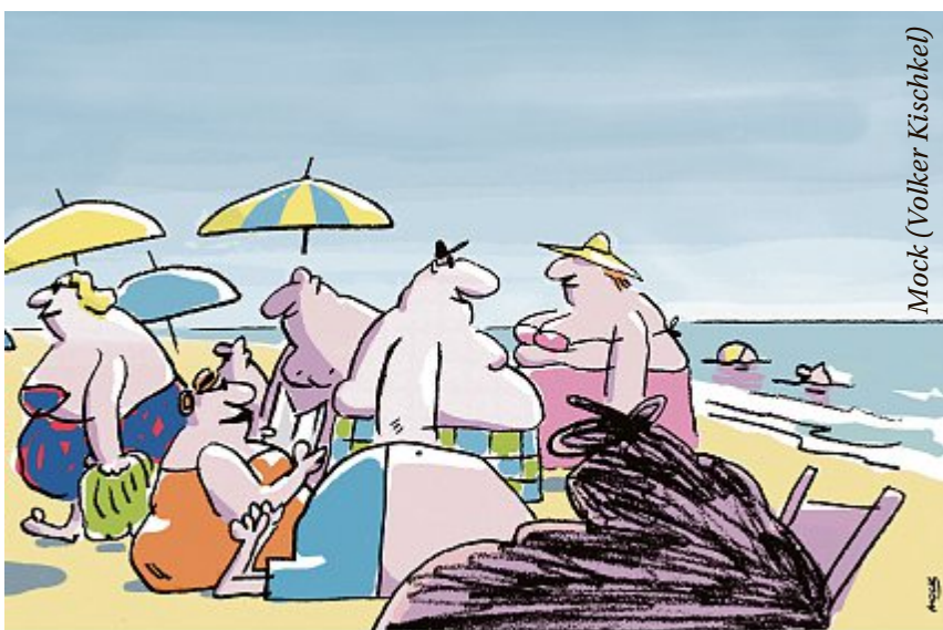
Mock (Volker Kischkel)