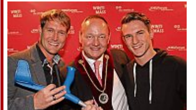
Bilderbogen: Die «Winti Mäss» lockte gegen 40'000 Besucherinnen, darunter auch viele prominente Persönlichkeiten an.