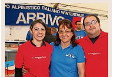
ck Albanifest-Einsatzfreude: Gruppo Alpino Italiano Winterthur.

Sportfest Das Winterthurer Albanifest vom kommenden Wochenende ist auch ein Fest für die Sportvereine. Zahlreiche lokale Sportclubs bieten in ihren Festwirtschaften leckere Köstlichkeiten an. Die Vereinsmitglieder zeigen dabei viel Einsatzfreude und generieren einen schönen Batzen in die Vereinskassen.