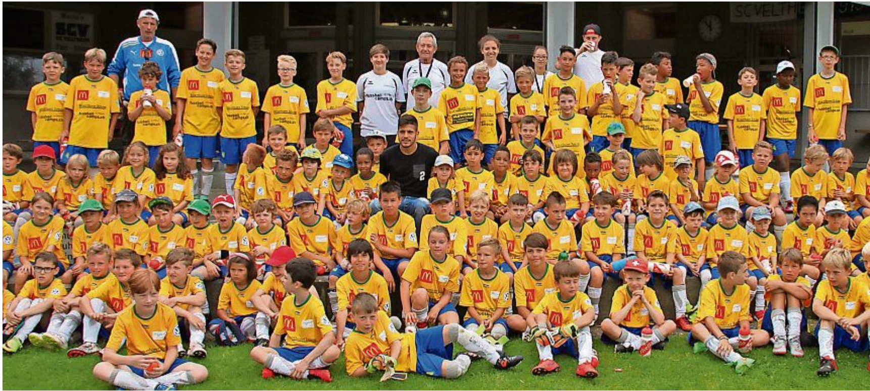
Souvenirbild des letztjährigen Fussballcamps auf dem «Flüeli»: Viele fussballbegeisterte Kids sind auch in diesem Jahr wieder dabei.